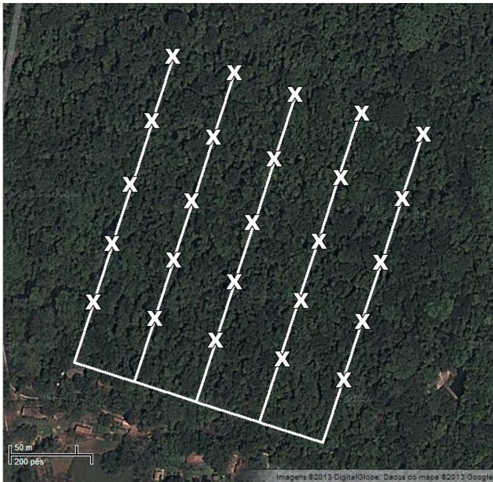
Figura 1. Em destaque o Parque Estadual do Prosa (PEP) as linhas brancas representam os transectos dispostos 50m um do outro e os pontos marcados com "X" são local onde foi colocado cada armadilha.