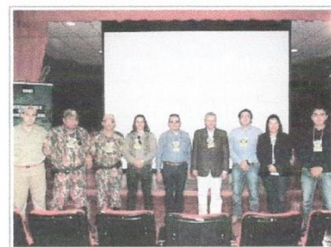
Porto Murinho reforça o foco no tratamento do lixo e proteção de mananciais