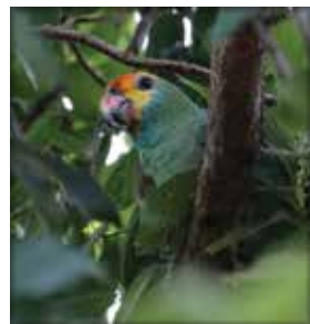
Carlos E. S. Garske

Cada papagaio tem um nome popular que às vezes muda de um lugar para o outro. Mas todos têm um nome científico para serem reconhecidos em qualquer lugar do mundo. Os papagaios são conhecidos pelo gênero Amazona . No total são conhecidas 12 espécies de papagaios no Brasil. Cada espécie tem um nome popular, mas todos são chamados de "papagaios". Tem o papagaio-do-mangue, papagaio-da-várzea, papagaio-verdadeiro, papagaio-moleiro, papagaio-campeiro, papagaio-charão, papagaio-de-bochecha-azul, papagaio-de-cara-roxa, papagaio-chauá, papagaio-de-peito-roxo, papagaio-dos-garbes, papagaio-diadema.