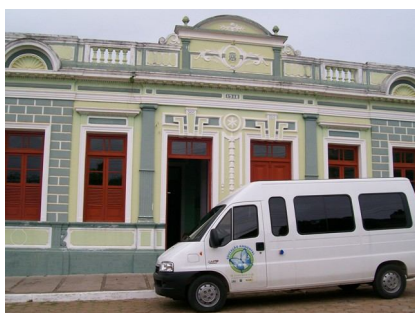
Van do projeto "Educação Ambiental Itinerante."

No período de 2009 a 2010, com a aprovação do projeto "Educação Ambiental Itinerante", financiado pelo Programa Pantanal (MMA/SRHU), foram percorridos 16 municípios da Sub-bacia do Rio Miranda, a saber: Anastácio, Aquidauana, Bandeirantes, Bodoquena, Bonito, Corguinho, Dois Irmãos do Buriti, Guia Lopes da Laguna, Jaraguari, Jardim, Maracaju, Miranda, Nioaque, Rochedo, Sidrolândia e Terenos. Em cada município foi realizada a articulação e a mobilização das instituições locais para realização de uma oficina de consulta pública. No total foram visitadas 514 instituições e 418 pessoas participaram da oficina.