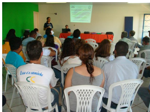
Oficina de consulta pública em Sidrolândia/MS.

UCDB - Universidade Católica Dom Bosco Av. Tamandaré, 6000 - Jd Seminário - Campo Grande - MS