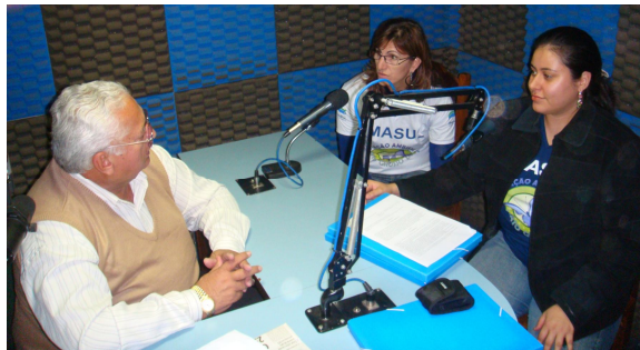
Divulgação da oficina em Aquidauana/MS (visita a instituições e entrevista em rádio).