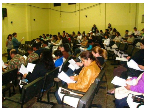
Oficina de consulta pública em Nova Andradina/MS (apresentação do texto e trabalho em grupo).

Terminado o projeto itinerante, foram realizadas oficinas em mais quatro municípios da Bacia do Rio Paraná (Amambaí, Nova Alvorada do Sul, Nova Andradina e Três Lagoas), de acordo com as atividades do IMASUL e em parcerias com outras instituições, com a visita a 173 instituições e a participação de 155 pessoas.