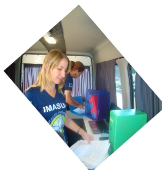
Adaptação interna da van.