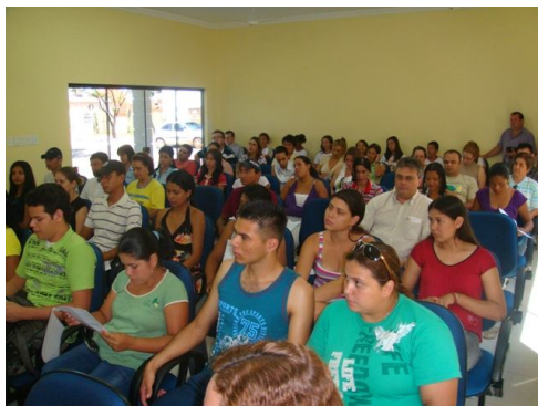
Oficina de consulta pública em Jardim/MS.

Terminado o projeto itinerante, foram realizadas oficinas em mais quatro municípios da Bacia do Rio Paraná (Amambaí, Nova Alvorada do Sul, Nova Andradina e Três Lagoas), de acordo com as atividades do IMASUL e em parcerias com outras instituições, com a visita a 173 instituições e a participação de 155 pessoas.