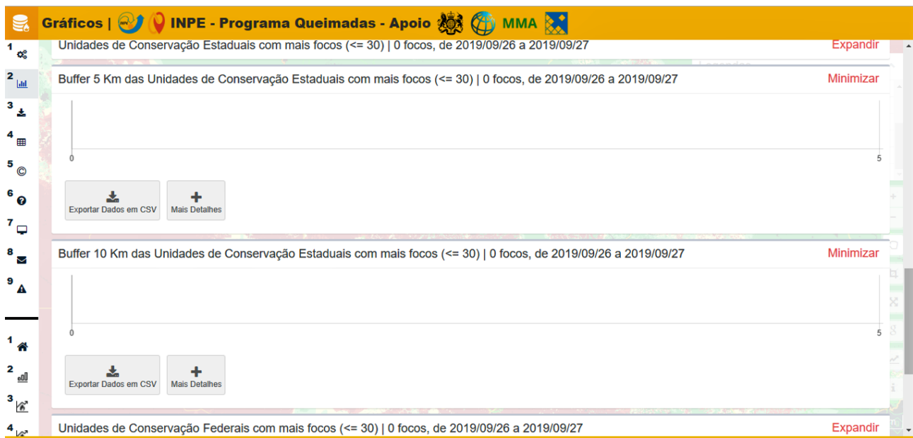
Figura 1. Buffer das UCs Estaduais no Estado de Mato Grosso do Sul com mais focos 27/09/2019.