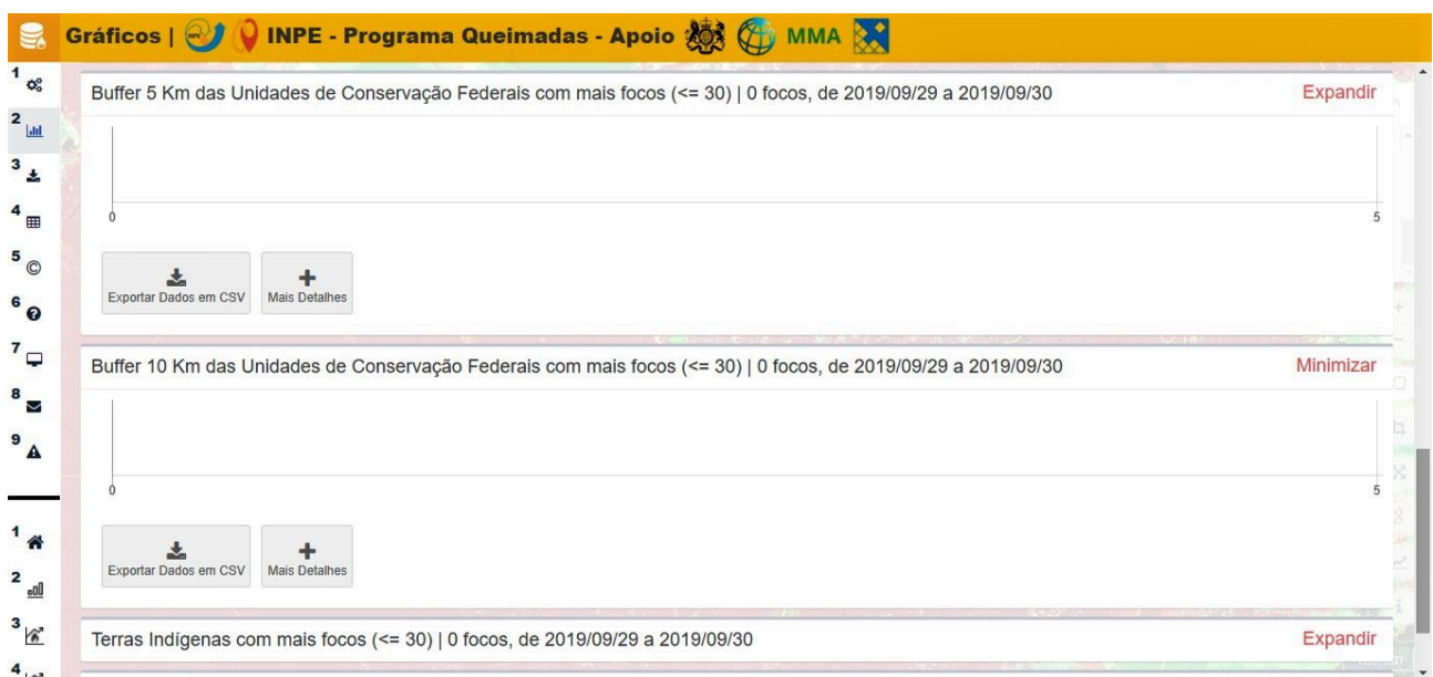
Figura 1. Buffer das UCs Estaduais no Estado de Mato Grosso do Sul com mais focos 30/09/2019.